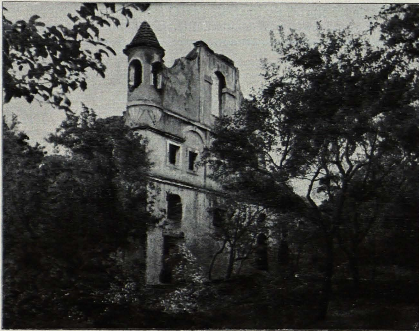
Fig. 183 Zeissing, Schloßruine (S. 285)

Gelblich gefärbeltes, vierseitiges, einstöckiges Gebäude, mit Ortsteinen eingefaßt, mit bandförmigem Sockel und breitem Hohlkehlgemise, an dem die Reste eines gemalten Frieses aus länglichen Rauten mit Rechtecken alternierend, auf weißem Grund sichtbar sind. Im N. rundbogiges Einfahrtstor in imitierter