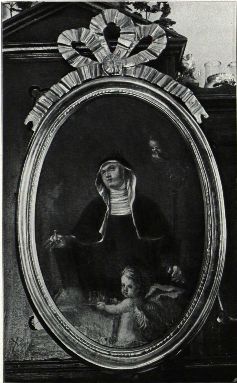
Fig. 60 Etsdorf, Heilige Notburga von L. Mitterhofer (S. 130)

2. Linker Seitenaltar: Sarkophagunterbau, gemauert, Aufbau aus Säulen und Pilastern, Holz, marmoriert, links und rechts je eine allegorische Figur, Glaube und Hoffnung, als Bekrönung Auge Gottes in Strahlen- glorie, jederseits eine Frau mit Kindern (Liebe); alles Holz weiß emailliert und zum Teil vergoldet; Altar- bild Marter des hl. Johann Nep. Von einem österreichischen Maler aus dem ersten Drittel des XVIII. Jhs. Laut einer Notiz im Taufbuch wurde der Altar von Herrn Ferdinand Widhalm zu Stätteldorf 1725 gestiftet.