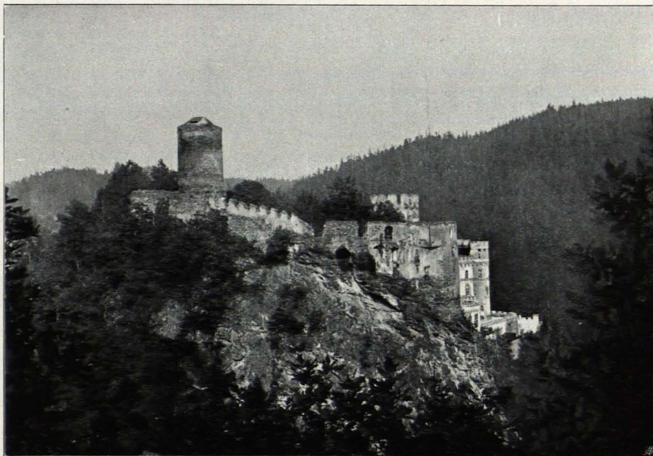
Fig. 51 Hartenstein, Ruine (S. 118)

der zweiten Hälfte des XVI. Jhs. angehören; auch hier fehlen Zwischendecken und Bedachungen. An der Nordseite dieses oberen Hofes steht ein etwa 20 m hoher, sehr massiver Turm (G), der, auf der höchsten Terrasse des ungleichen Burgterrains gelegen, die ganze Anlage überragt. An die zinnengekrönte Mauer, die die Burg in Ansehmigung an den steilen Felsrand umfriedet, sind an mehreren Stellen kleine Nutzgebäude angebaut.