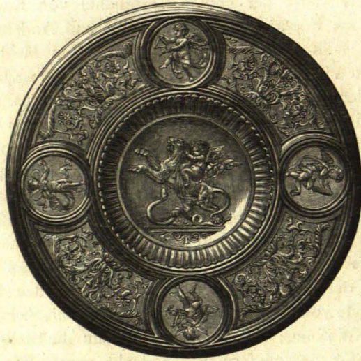
Vifitière in vergoldeter Bronze, nach Entwurf von A. Hauser ausgeführt von J. Grüllemeyer in Wien.