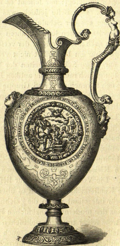
Taufkanne in vergoldetem Silber, im Besitz des Grafen H. Herberstein-Eggenberg. 16. Jahrhundert.