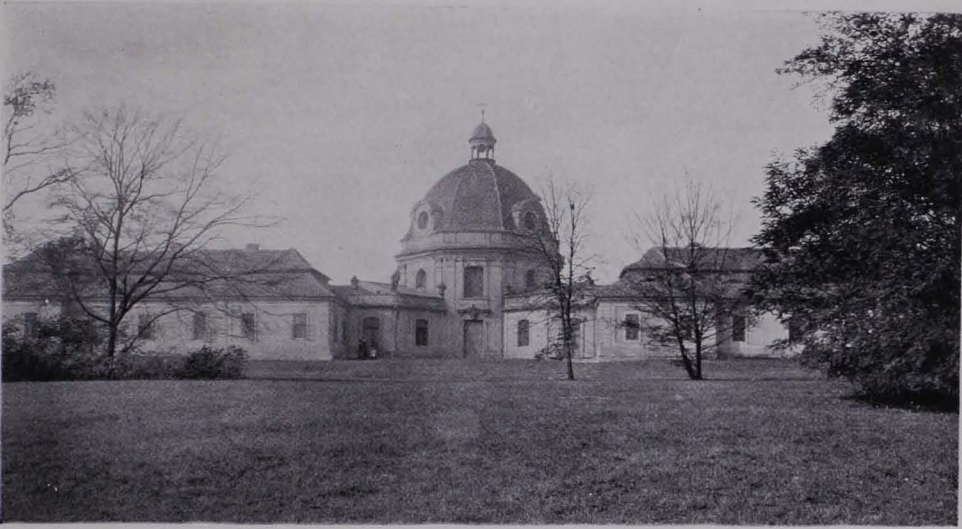
Abb. 69. Dux, Hospital. Gesamtansicht vom Park aus

gruppieren sich um Höfe mit abgeschrägten Ecken und stoßen nach außen in scharfkantigen Risaliten vor. So entsteht ein reich figuriertes Gebilde von schmetterlingartigem Aussehen. Im Aufriß hält sich das eigentliche Hospital flach einstöckig und maßvoll gegliedert. Über diese Horizontale steigt der mächtige Kuppelbau empor, der in der Gedrungenheit und trotz der Feinheit seiner Gliederung feisten Behäbigkeit einen eigenartigen Gegensatz zu der vornehmen Art der Gartenfassade des Schlosses bildet. In der Grundrißanlage zeigt sich eine gewisse Verwandtschaft mit der Kreuzherrnkirche und die Gliederung ist von derselben kühl-eleganten Prägnanz wie dort. Nur ist in Dux das Fassenverhältnis im Sinne stärkerer Bewegtheit interpretiert. Der Freiraum hat die Mauer-substanz förmlich ausgefressen und dringt spaltend wie ein Keil in den Baukörper ein, dem sich die Mauer-masse der Kirche haltgebietend entgegenstemmt. Der Kirchenkörper macht den Eindruck eines zwischen Häuser eingeklemmten Tambours, über dem sich eine Rippenkuppel mit gedrungener Laterne erhebt.