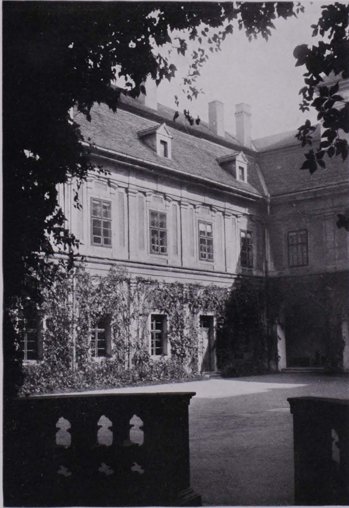
Abb. 68. Rotenhaus bei Görkau. Schloßhof