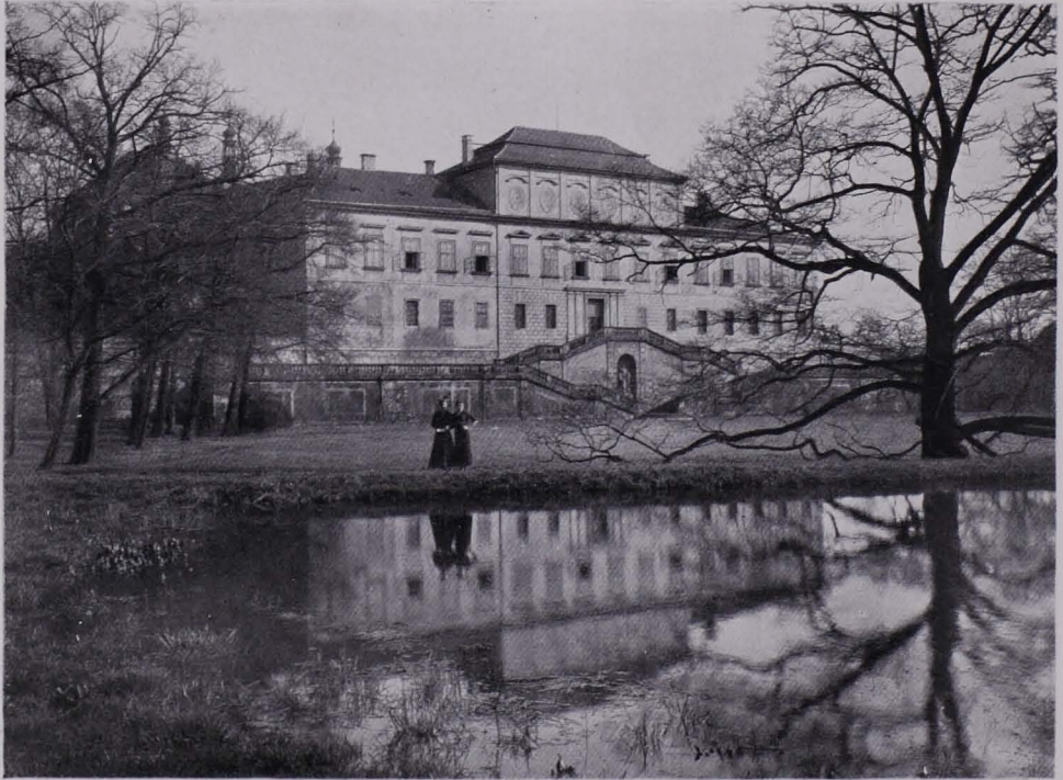
Abb. 64. Dux, Neues Schloß. Gartenseite

solch verschobene Gestalt verliehen (Abb.65 u.66), aber höchstwahrscheinlich war der Mittelflügel ursprünglich freistehend und im Ausmaß etwas kleiner; wie anders wäre sonst die Achsenverschiebung zu erklären? Ist dies richtig, dann sind also die Seitenflügel spätere Additionen, als man darauf bedacht war, den einzeln stehenden Trakt mit dem alten Schloß zu verbinden. Dies könnte sehr wohl erst durch Johann Joseph von Waldstein vorgenommen worden sein, dem 1707 Dux von Ernst Joseph von Waldstein erblich überkam 4) . Schält man aus dem verworrenen Plansystem des Mittelflügels das kompakte Mauerwerk heraus, das mit den Außenmauern parallel geht, so erhält man ein System, das auf der Linie Troja-Platz liegt und schon darum für Mathey in Anspruch zu nehmen ist 5) . Nur kompliziert sich die Sache, wenn aus diesem neugewonnenen System der Aufriß hergestellt werden soll. Der große Saal umfaßt wie in Troja und Platz fünf Achsen und legt sich durch zwei Stockwerke hindurch (Abb.67). Da er im Außenbau entsprechend seiner Bedeutung herauszuheben ist, so ergibt sich im zweistöckigen Gesamtsystem ein aufgestocktes Mauerplus von fünf Achsen. Die jetzige Außenerscheinung zeigt aber eine sechs Achsen breite Aufstockung. Die eine Achse zählt jedoch nicht zum Saal, ist also sinnwidrig, son-