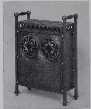
Abb. 120. Elektrischer Ofen in Schmiedeeisen der AEG. 1909

seinsbedingungen, die, im Zusammenhang mit unserem gesamten wirtschaftlichen Aufschwung entstanden, als Stil oder ästhetische Ausdruckselemente solange noch indifferent erscheinen, als die neue Seele, die künstlerisch-plastische Idee unserer modernen Empfindens sich ihrer noch nicht bemächtigt hat. Daß aber zu dieser unlösbar in sich geschlossenen Synthese von Inhalt und