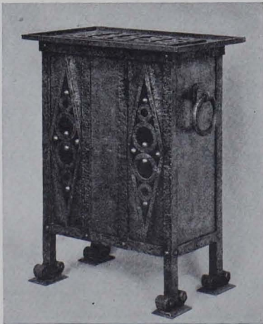
Abb. 119. Elektrischer Ofen in Schmiedeeisen der AEG. 1909

Den Platz vor diesem Zentralbau nahmen Gartenanlagen mit Teppichbeeten ein, die von einer Laubenreihe gäumt wurden. Einen zauberischen Effekt zeigten sie nach einbrechender Dunkelheit, wenn alle ihre architektonischen Linien in dem