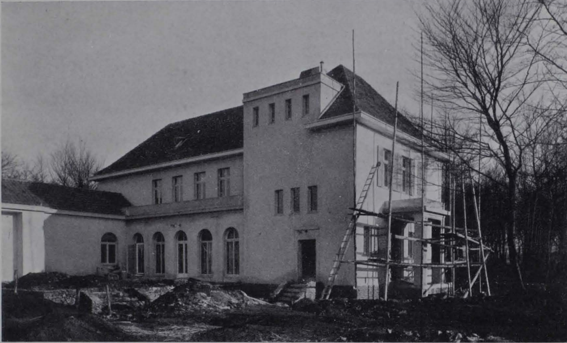
Abb. 98. Wohnhaus Goedecke in Eppenhafen bei Hagen i. Westf. 1911 bis 1912. Ansicht von der Gartenseite

man, daß die für den Bau zur Verfügung gestandenen Mittel keineswegs reich bemessen waren, und daß Neuß selbst ein Städtchen von nicht viel mehr als 30000 Einwohnern, Arbeitern und Kleinbürgern, ist, also wohl kaum zu den Orten rechnet, wo künstlerische Initiative für die Moderne auf eine starke Resonanz zählen darf: Aber gerade durch ein solches Milieu mit seinen eigentümlichen Reibungen und Widerständen erlangt der Bau des Gefellenhauses seine hohe zeitpädagogische Bedeutung, ähnlich den in einer schwäbischen Kleinstadt gelegenen Pfullinger Hallen Theodor Fischers, zu denen es auch in seinem sachlichen Inhalt als Gesellschaftshaus vielfach eine Parallele bildet. — In der Konkurrenz schied Riemerschmid gleich zu Anfang wegen Zeitmangels aus 1) , und Behrens trug den Bauauftrag davon. Nach mancher-