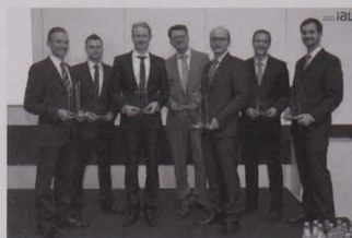
Abb. 1: Preisträger Hermann-Appel-Preis, Berlin

„Hermann-Appel-Preis“ für herausragende Nachwuchs-Ingenieure (Diplomarbeiten und Dissertationen) verliehen (siehe Abb. 1), was für einen österreichischen Bewerber besonders bemerkenswert ist.