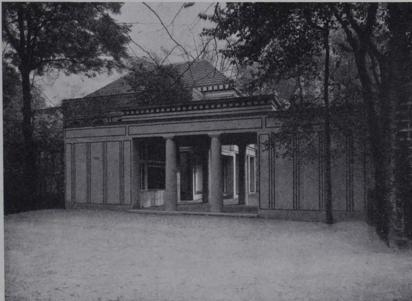
Abb. 54. Tonhaus in der Flora zu Köln. 1906. Portalbau

Emporen befinden und ein chorartiger Vortragsraum mit ausgebildetem Querschiff und prächtig ausgezierter Apfis dem Langhaus angerückt ist. Geeint wird der in seinen Teilen heterogene Raum durch die großen Triumphbogen vor dem Querschiff und der Apfis und durch die durchgehende flache Decke. Die sinnfällige Gliederung der Architektur befolgen wieder die bekannten Behrenschen Lineamente, Achtecke und die beliebten Borten. Große Volutenmotive erfüllen die Zwickel der Triumphbogen. In reichem Schmuck prangt nur die Apfis, als Standort des Flügels die Quelle der künstlerischen Darbietung und das Ziel andächtiger Aufmerksamkeit: Unten ist das Halbrund der Wand durch dicke Halbsäulen fünffach geteilt. Die so entstandenen Felder zeigen ein kostbar intarsiertes, strenges Rechteckmuster als Mittelfüllung. Darüber ruht wieder eine Art Metopenfries, während die eigentliche Concha ein feierliches Mosaik auf Goldgrund von E. R. Weiß enthält, das heute noch an der gleichen Stelle im Hagener Krematorium zu sehen ist. — Es wäre durchaus laienhaft, anzunehmen, daß die eigentümlich heilige Stimmung, die diesem Festraume zu eigen, lediglich eine Funk-