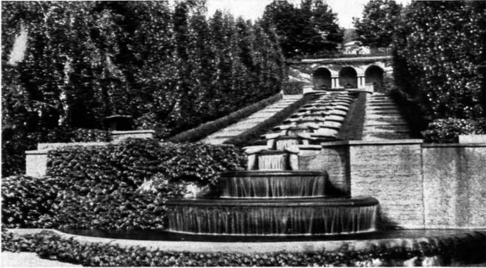
224. Max Läger: Teilstück der „Paradies“-Anlage. Baden-Baden. 1922/23