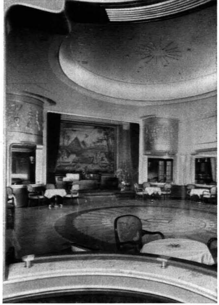
217. Ludwig Troost: Ballsaal der „Europa“