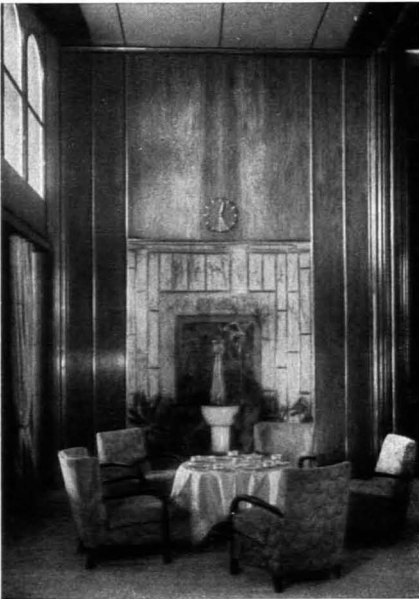
218. Fritz Aug. Breuhaus: Teehalle der „Bremen“