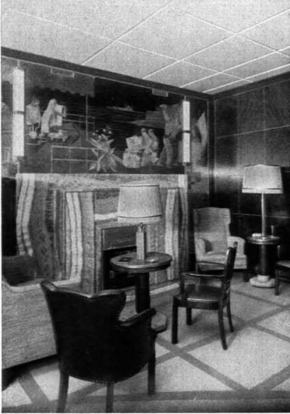
216. Rud. Alex. Schröder Rauchzimmer der „Bremen“