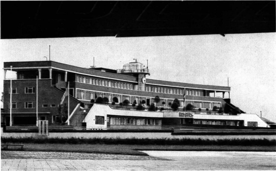
214. Dyrssen und Averhoff: Empfangsgebäude des Flughafens Hamburg. 1927/28