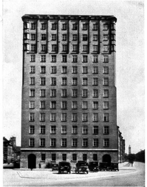
184. Münchener Hochbauamt (Leitenstorfer): Technisches Rathaus. 1926