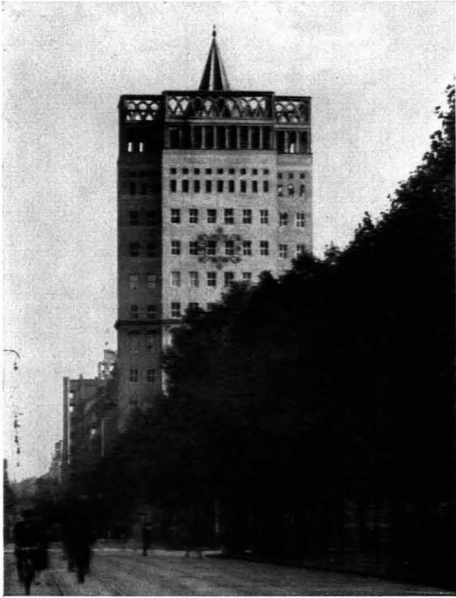
183. Wilhelm Kreis: Wilhelm-Marx-Haus in Düsseldorf. 1922/24