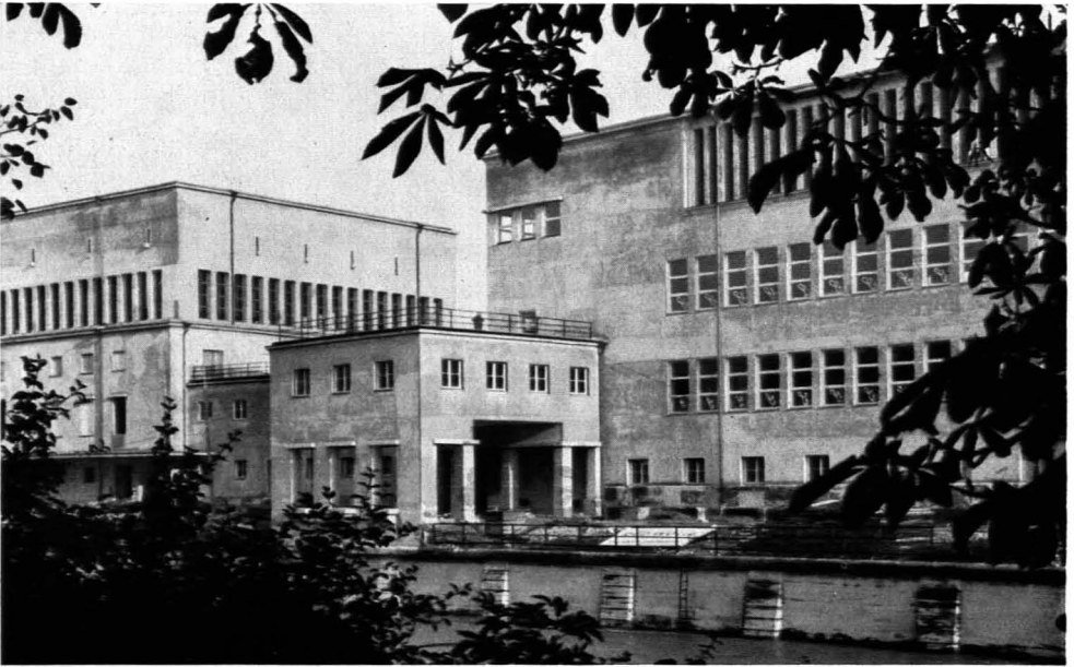
174. German Bestelmeyer: Bibliotheksbau des „Deutschen Museum“ in München. Begonnen 1930