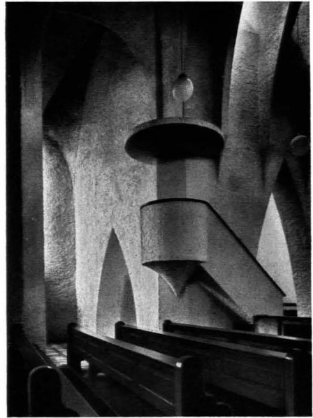
164 und 165. Dominikus Böhm: Kath. Kirche in Bischofsheim. 1926. Kriegergedächtniskirche in Neu-Ulm. 1923