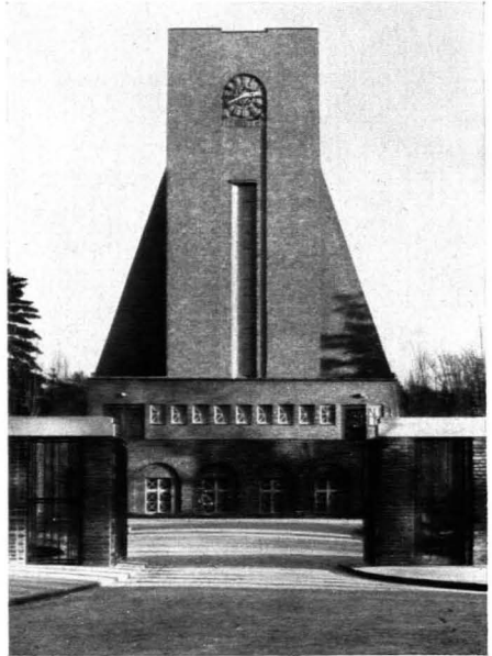
166 und 167. Fritz Schumacher: Friedhofskapelle. 1928. Krematorium in Hamburg. 1930