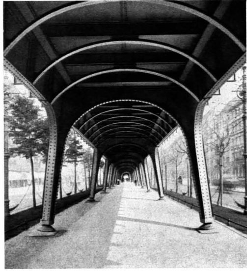
150. Alfred Grenander: Stadtbahn Berlin. 1909