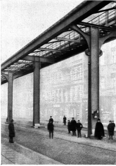
149. Bruno Möhring: Stadtbahn Berlin. 1909