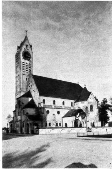
109. Theodor Fischer: Erlöser-Kirche in München. 1899/1901