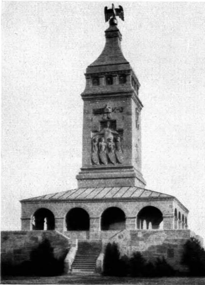
108. Theodor Fischer: Bismarckturm am Starnberger See. 1898/99