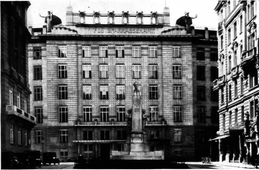
106. Otto Wagner: Postsparkasse in Wien. 1905