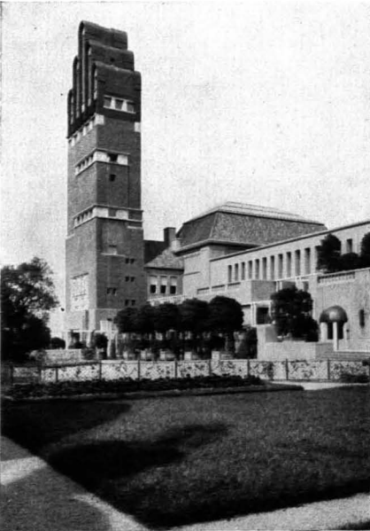
104. Joseph M. Olbrich: Hochzeitsturm, Darmstadt. 1907