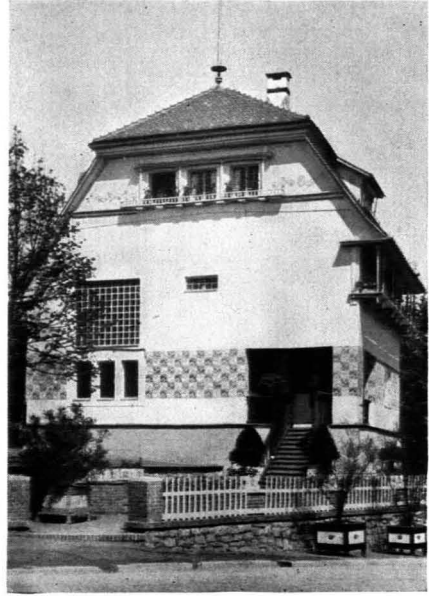
103. Joseph M. Olbrich: Haus Olbrich, Darmstadt. 1901