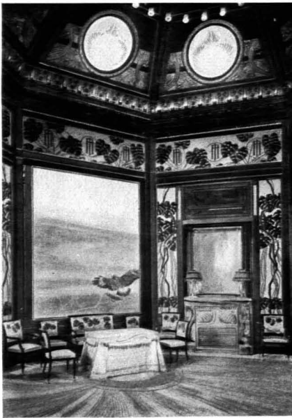
98. Otto Wagner Wartesalon des Kaisers in der Wiener Stadtbahn. 1898