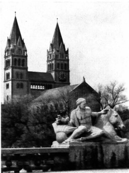
70. Heinr. v. Schmidt: Maximilianskirche in München