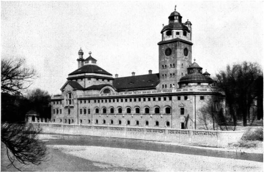
67. Karl Hocheder: Müllersches Volksbad in München. 1897/1900