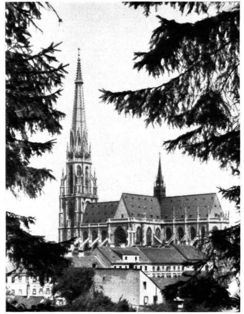
41. Vinzenz Stätz: Neuer Dom in Linz. Begonnen 1862