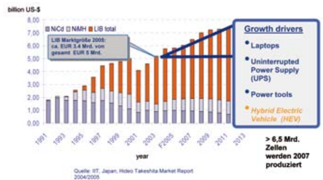
Abb. 1: Marktentwicklung der Nickel-Cadmium, Nickel-Metallhydrid und Lithium-Ionen-Batterien (LIB)

www.varta-automotive.com http://data.energizer.com www.batteryuniversity.com