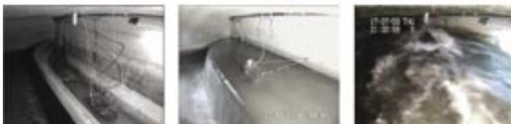
Abb. 1: Schwimmendes Ponton mit integriertem UV/VIS-Spektrometer bei unterschiedlichen Abflussverhältnissen in einem Mischwasserkanal.

Die Fotos der Abb. 1 zeigen ein in Graz im Bereich einer Mischwasserentlastung direkt im Kanal installiertes, schwimmendes Ponton bei unterschiedlichen Abflussverhältnissen. Direkt im Kiel des Pontons eingebaut ist ein UV/VIS-Spektrometer, der es erlaubt, die unterschiedlichen Wasserqualitäten in-situ im Abwasserstrom zu messen.