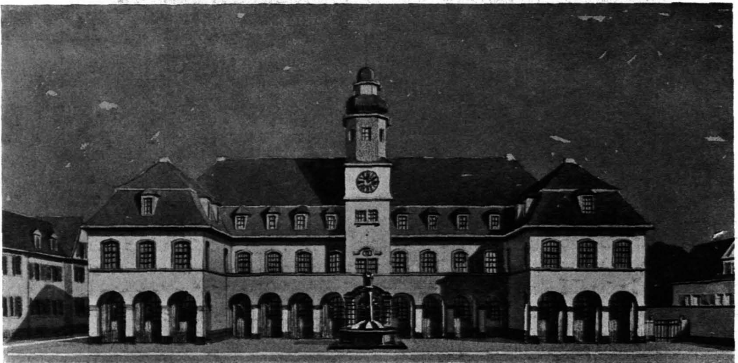
Abb. 77. SCHAUBILD.

Nun wollte es bald darauf der Zufall, daß eine Stadtgemeinde ein Rathaus ebenfalls im öffentlichen Wettbewerb ausschrieb.