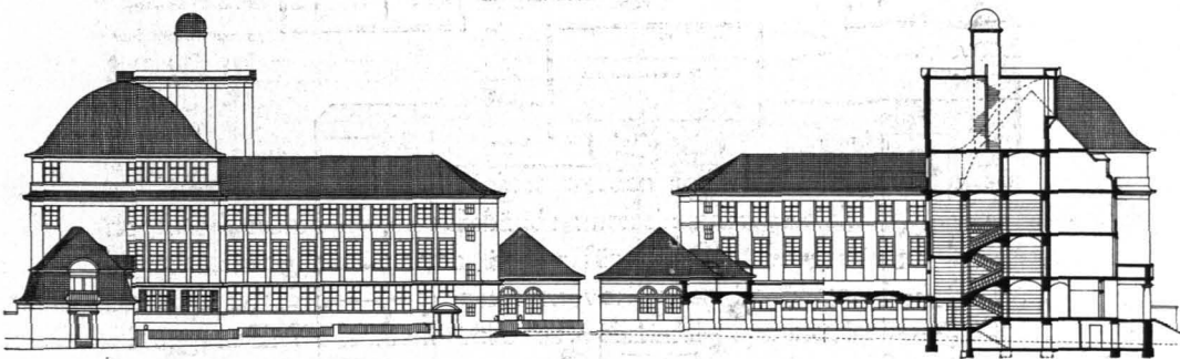
Abb. 62. QUERSCHNITT a b.

⟨Südwestecke⟩. So z. B. der Lehrsaal für Naturwissenschaft nebst Nebenräumen, der Lehrsaal für Physik nebst Nebenräumen und derjenige für Chemie nebst Nebenräumen, letzterer mit Rücksicht auf die aufsteigenden Dünste, im Dachstock. Die entgegengesetzte Ecke nimmt die Aula auf, die durch zwei Geschosse geht; darüber befindet sich der nördlich gelegene Zeichensaal.