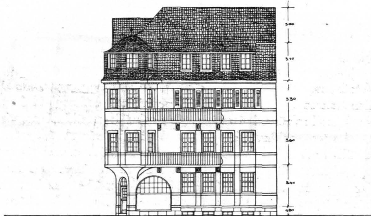
Abb. 28. SEITENANSICHT.

in den Stockwerken nach beiden Seiten Balkone an, welche die ohnedies schon gelagerte Baumasse sehr günstig beeinflussen. Abb. 27 zeigt, in welcher behäbiger Weise die Gruppe in dem Straßenbild zum Ausdruck kommt.