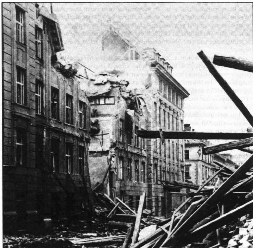
Abb. 28: Am 1. November 1944 wurde die »Neue Technik« durch drei Bombentreffer schwer beschädigt.

besonders in den letzten Monaten dieses furchtbarsten aller Kriege der Hochschule zugefügt wurden...« 96