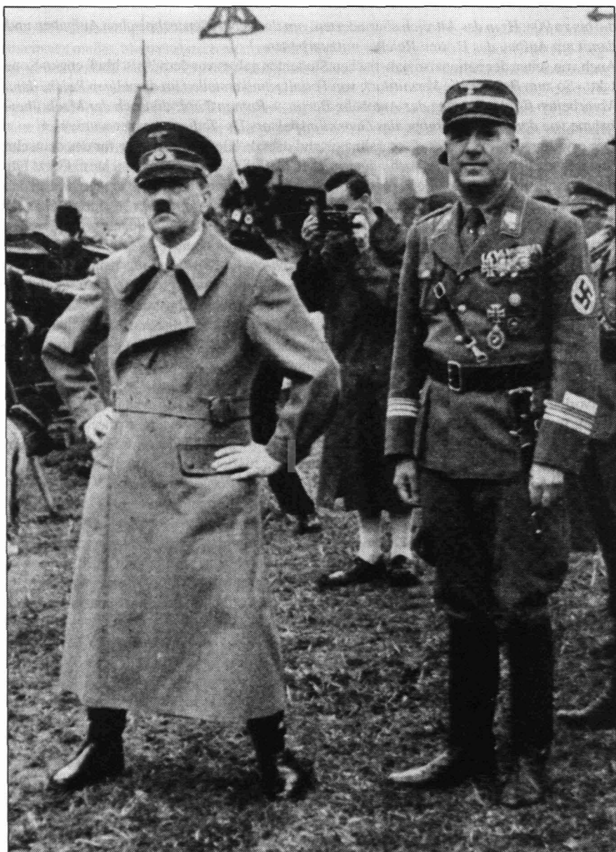
Abb. 23: Adolf Hitler und Fritz Todt, der »Generalinspektor für das deutsche Straßenwesen«, beim »1. Spatenstich für die Reichsautobahn in der Ostmark« am 7. April 1938.