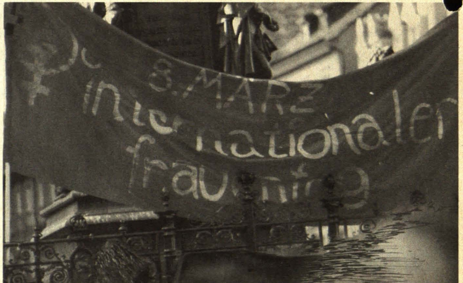
Veranstaltungen zum 8. März (Internationaler Frauentag)

Eine bloße Aufzählung der Projekte und Aktivitäten des Frauenreferates während der letzten zwei Jahre erscheint mir nicht sooo interessant, daher wähle ich eine andere Form der Darstellung. Vollständig kann sie nicht sein, doch läßt sich auf diese Art und Weise sicher ein Eindruck unserer Veranstaltungen vermitteln.