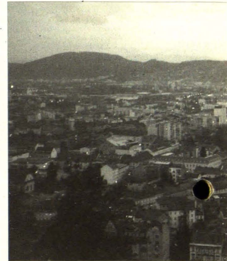
Blick auf Graz vom Schloßberg. Die Stadt lebt