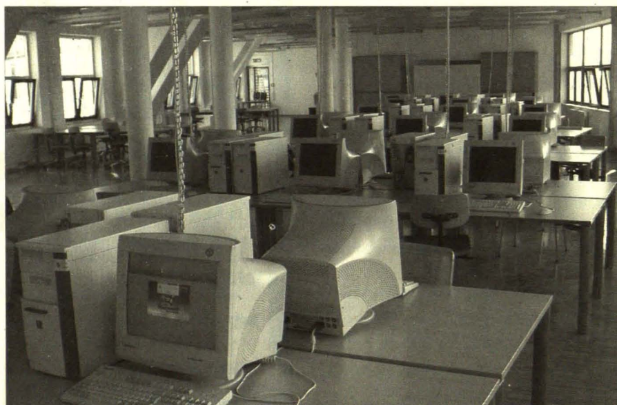
Ein Computerraum im Studienzentrum Inffeldgasse 10

Eine Abmeldung oder Umbenennung des Accounts ist nicht vorgesehen. Wird der Account allerdings drei Semester lang nicht verlängert, wird er automatisch gelöscht.