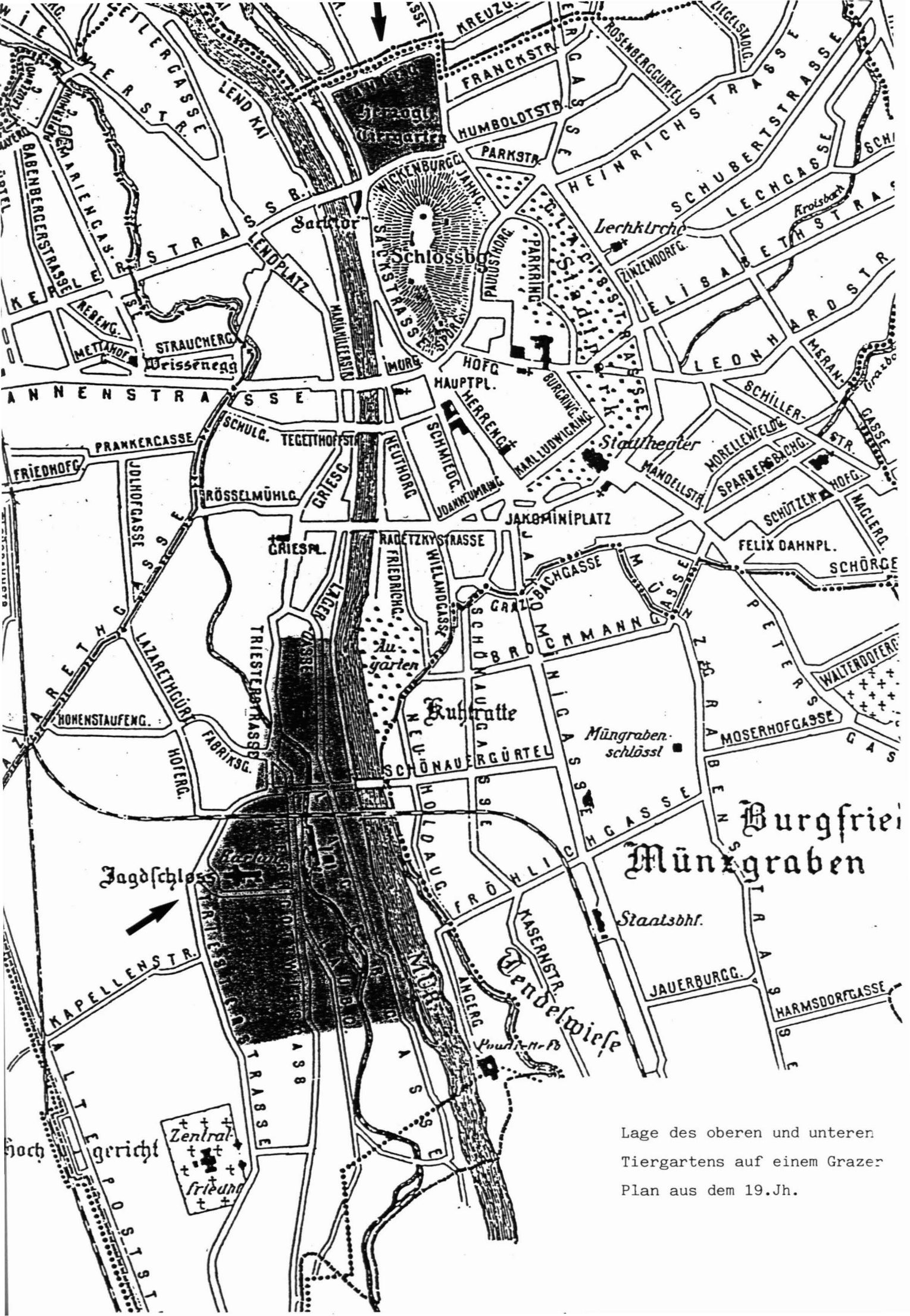
Lage des oberen und unteren Tiergartens auf einem Grazer Plan aus dem 19.Jh.