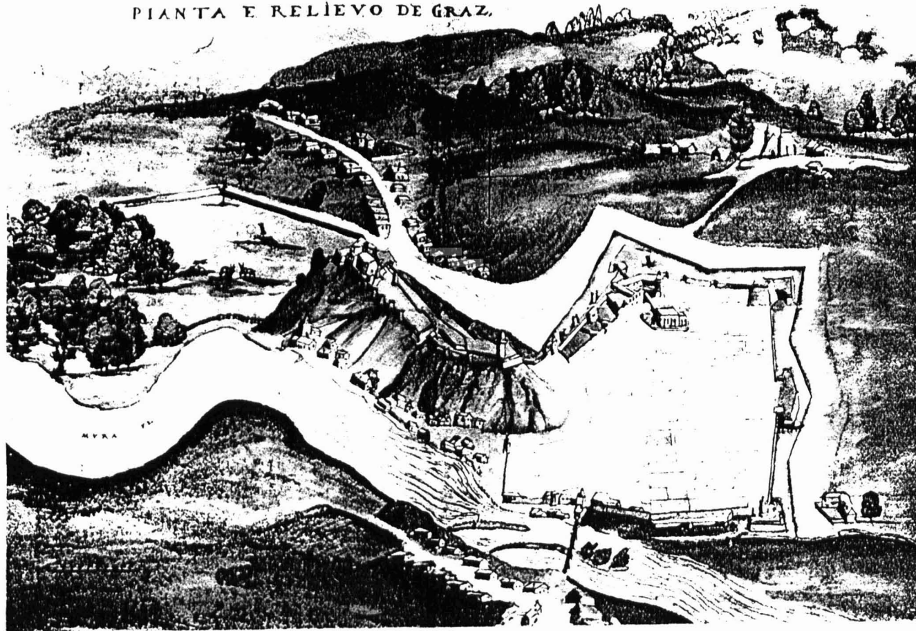
Graz 1565. Links hinter dem Schloßberg ist gut der ehemalige obere Tiergarten zu erkennen. Öst.Natbibl. Codex 8609