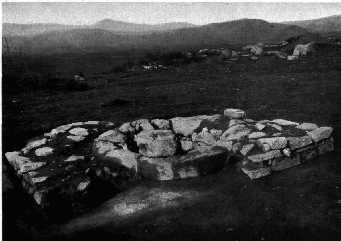
Abb. 65. Der Altar von Südosten (1905).

Dörpfeld scheidet jetzt drei Bauperioden. Den Kern bildet ein Rundaltar; der Grundriß ist ziemlich genau ein Kreis (Durchmesser 2,02—2,06 m). Auf einem etwa 60 cm tiefen Funda-