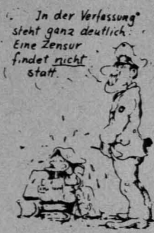
* Verfassung siehe unter „Kondition“.