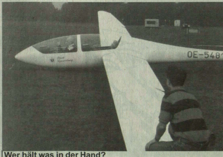
Wer hält was in der Hand?

Unsere Webpage findest Du unter: http://oeh.tu-graz.ac.at/~akaflieg Dort steht alles über unseren Verein, die Ziele und die laufenden Aktivitäten.