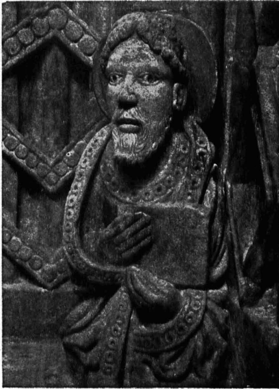
Abb. 23. Riesentor, Nordleibung; 4. Apostel nach der Restaurierung