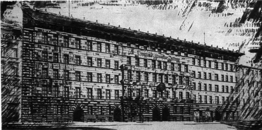
Ein dritter Preis: Third prize design Arch.: Theobald Schöll