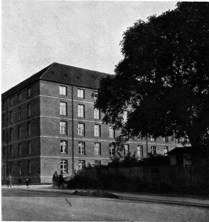
257 / COPENHAGEN Vognmandsmarken. Arch.: Kay Fisker