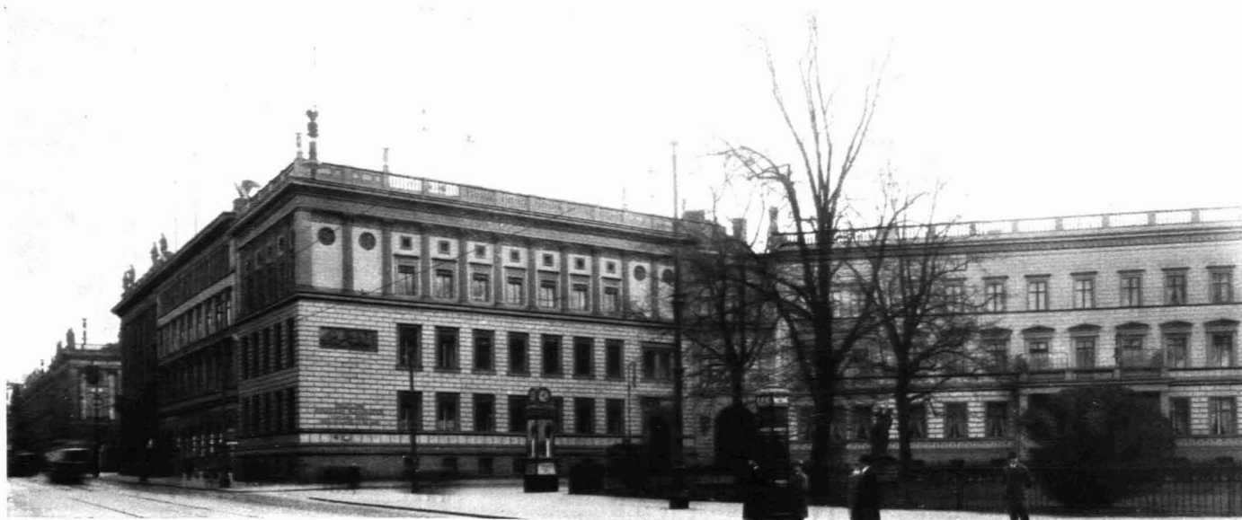
42 / BERLIN. SÜDOST-SEITE DES LEIPZIGER PLATZES

nicht nur technisch, sondern vor allem stadtbaukünstlerisch betrachtet. Die großartige Leipziger Straßenfront des Wertheim-Baues (Abb. 394) mit ihrem Versuche, eine durch fünf Geschosse reichende Pfeilerhalle vorzutäuschen, ist später überboten worden durch die nicht einmal mehr durch Pfeiler aufgeteilten, unermesslichen Glasvorhänge des Warenhauses Tietz (Abb. 391) und