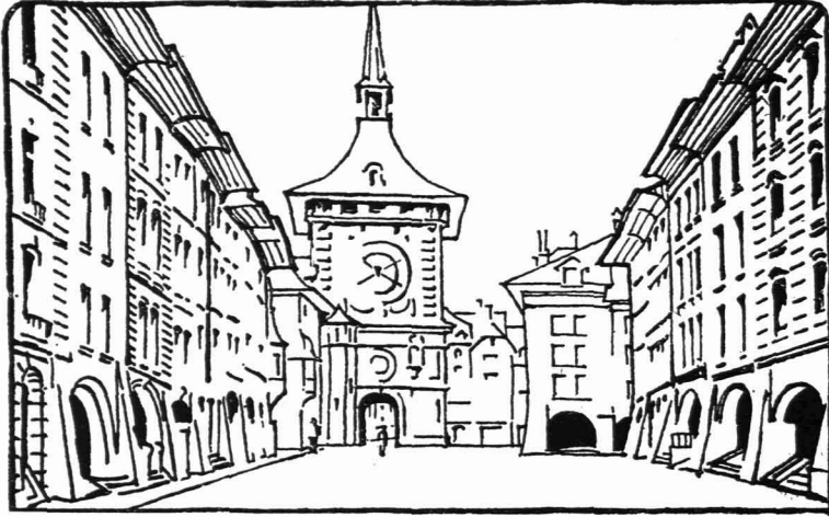
11 / BERN. KRAMGASSE (Nach Camillo Sitte. Vgl. S. 28)

Sansovino machte sich nichts daraus, zwei ganz unvereinbare Fassaden-Systeme nebeneinander zu stellen (Abb. 17). Aber Sansovino war auch einer der Führer zur Überwindung dieser zusammenhanglosen „Fassaden“-Spielerei. Die stadt-baukünstlerische Einsicht kam Sanmicheli (Abb. 43) und seinen Nachfolgern, wie Sansovino und Longhena, beim Bau von Palästen an den großen Wasserflächen und dem Markusplatze Venedigs. Sie sahen, wie das Sonderspiel der Einzelfassaden an diesen großen Räumen machtlos zerschmolz wie Zucker im Wasser. Sie wollten nicht mehr länger auf jeder Baustelle ein eigenes Spiel spielen. Ihre Paläste sollten nichts sein als gleichsam Stücke großer Säulenhallen, die den Canal Grande auf beiden Seiten umfassen. Infolge des plötzlichen wirtschaftlichen Niedergangs Venedigs sind von diesen Palästen, die den Canal Grande arkadenhaft