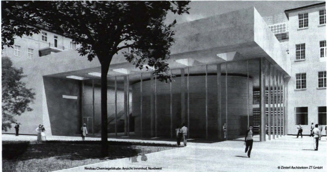
Neubau Chemiegebäude: Ansicht Innenhof, Northwest

spannungszeichensaal (HSZS) hat inzwischen ein neues Zuhause gefunden. Mittelfristige Baumaßnahmen betreffen die brandschutztechnische Sanierung des Hauses Inffeldgasse 25, die dritte Baustufe des Bautechnikzentrums und die Errichtung der Gebäude Sandgasse am Campus Inffeldgasse für Institute der