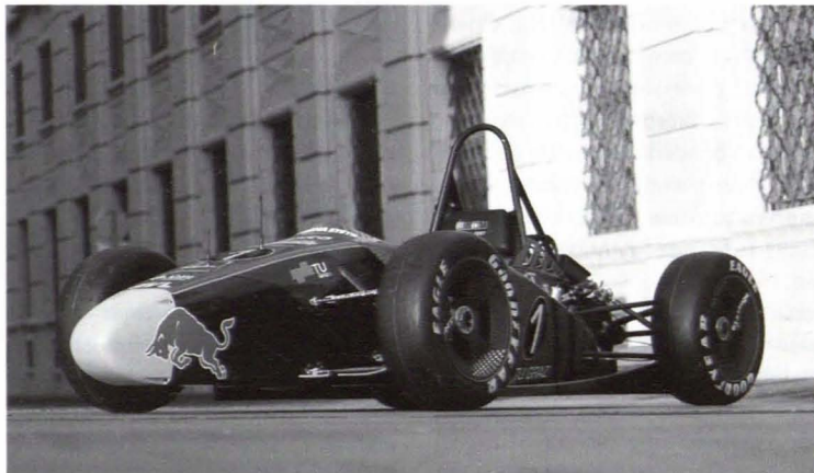
Der neue Tankia2007 (Fotoshooting in der Grazer Altstadt)

Für den Tankia2007 geht es ab jetzt auf die Teststrecke, wo wir versuchen werden, die perfekte Abstimmung für den Renneinsatz zu finden, um so noch die letzten Hundertstel Sekunden aus unserem Boliden rauszukitzeln. Der erste Bewerb der Saison 2007 findet von 12.-15. Juli 2007 auf der weltberühmten Rennstrecke