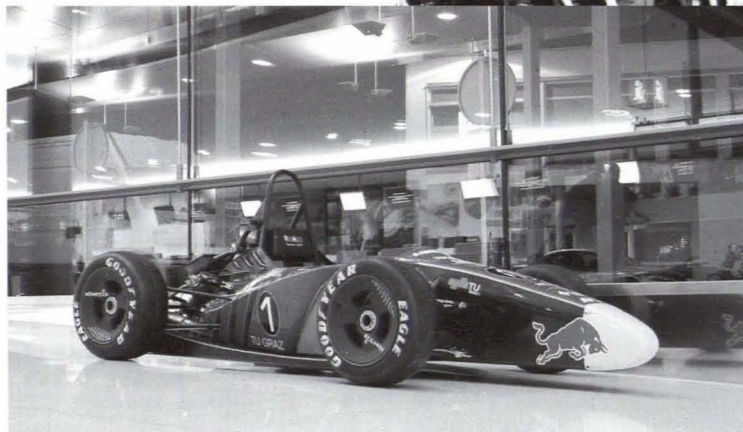
Der neue Tankia2007 (Fotoshooting am Flughafen Graz)