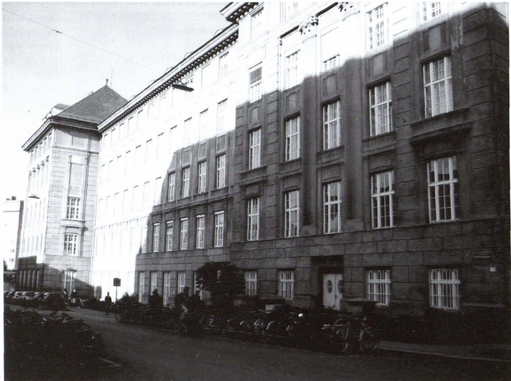
Das Institut für elektrische Maschinen und Antriebe in der Kopernikusgasse 1, Stock

Man kann sich vorstellen, dass dieses Verfahren doch einiges an Aufwand mit sich bringt. Am Ende eines solchen Verfahrens stehen dann öffentlich zugängliche Vorträge der Bewerber, die bereits in einen engeren Kreis gewählt wurden. Die Themen der Vorträge