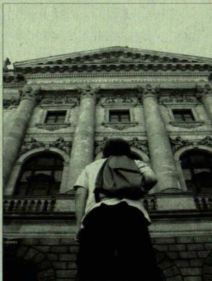
Zum ersten Mal vor der „Alten Technik“...

Für jede Universität / Hochschule, an der Du ein Studium beginnen willst, brauchst Du: