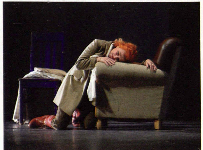
Lucia di Lammermoor

Nach einer langen, durchwachten Nacht schläft Cho-Cho-San endlich ein. In diesem Moment sieht Suzuki drei Menschen auf das Haus zukommen. Es sind Konsul Sharpless, Linkerton und seine amerikanische Frau. Sie wollen Butterflys Kind mitnehmen. Als Butterfly aufwacht, läuft sie sofort in den Garten und denkt, Linkerton habe sich nur versteckt, um sie