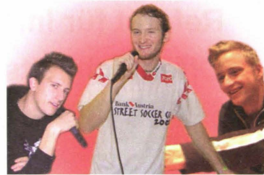
Team Fachbereich Sport

Der Bereich Sport ist zuständig für diverse Sportevents, wie zum Beispiel das ÖH-Fußballturnier, welches gemeinsam mit dem Sportreferat der ÖH Uni Graz veranstaltet wird. Auch der HTU-Skitag wird vom Fachbereich Sport veranstaltet. Weiters werden diverse Kurse wie Jiu Jitsu, Taekwon-Do oder Tanzkurse vermittelt und für TU-Studierende verbilligt angeboten.