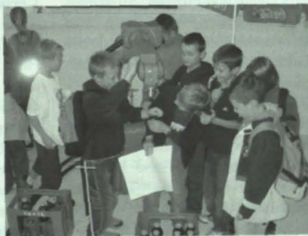
TU-Studenten in spe