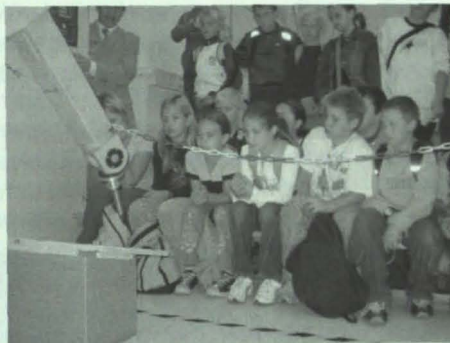
Die Kinder sind fasziniert von den Fähigkeiten des RIKO